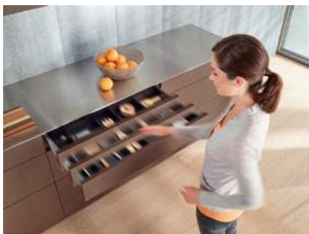
ning sahtel avaneb.