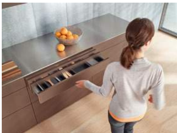
Pehme vajutus ja see sulgub.