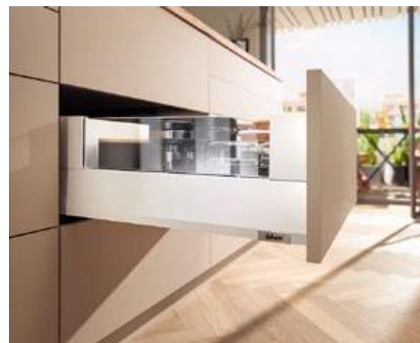
MERIVOBX modular sa BOXCOVER u svilenom beloj mat boji