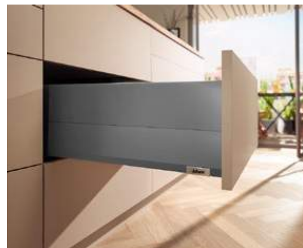
MERIVOBX modular con BOXCAP in grigio orione opaco