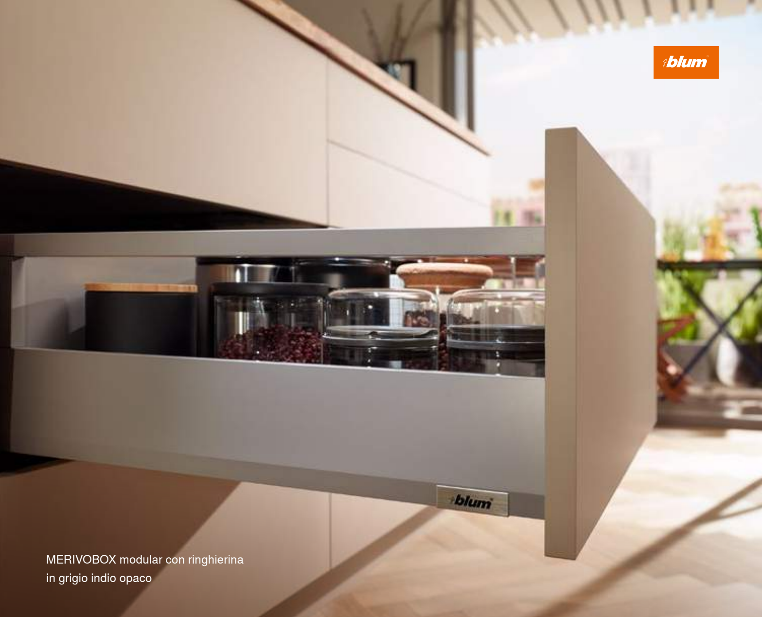
MERIVOBX modular con ringhiera in grigio indio opaco