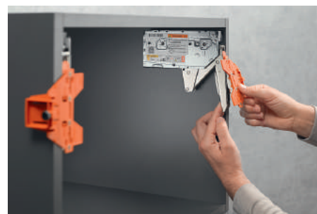
Encaixar o gabarito de marcação no acumulador de forças montado