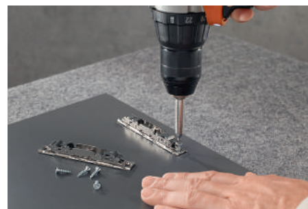
Aparafusar a fixação frontal nas posições marcadas