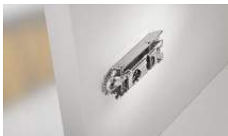
Pričvršćivanje montažne ploče u standardnom položaju