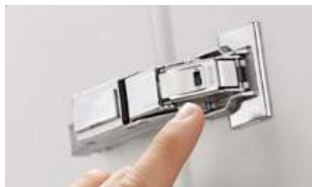
Vypínač na deaktivovanie BLUMOTION