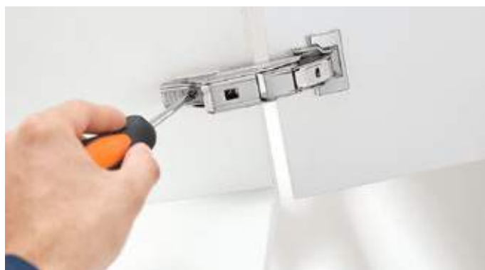
Štandardné a jednoduché nastavenie v troch smeroch