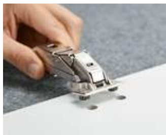
Osadíte hmoždiny do vyvŕtaných otvorov...