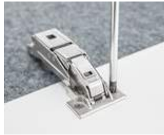
... Apertar parafusos e pronto