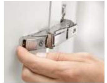
Montagem e desmontagem fáceis com o mecanismo CLIP