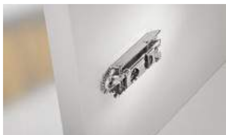
Montavimo plokštelės tvirtinimas standartinėje pozicijoje