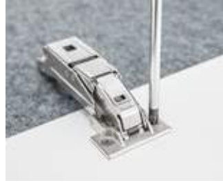
...ねじを締め付けて完了