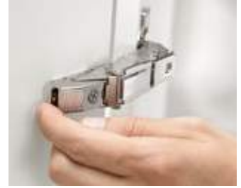
CLIP メカニズムによって着脱が容易に