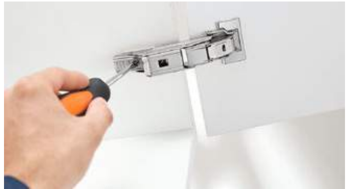
お馴染みの3方向調整機能