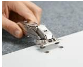
Inserire la bussola nei fori ...