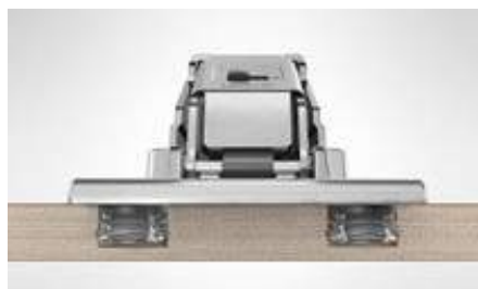
EXPANDO T, el innovador sistema de fijación