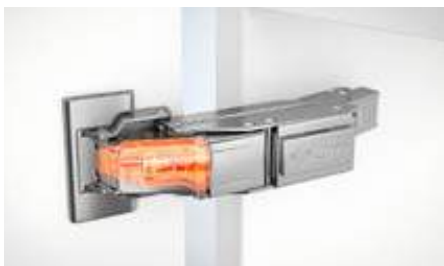
BLUMOTION integrado en el brazo de la bisagra