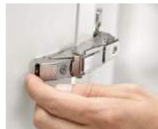
Enkel montering og afmontering ved hjælp af CLIP-mekanisme