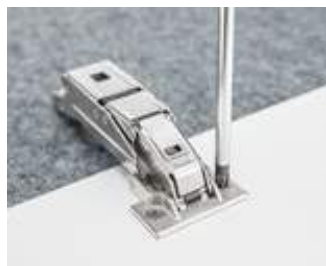
... Затягане на винтове, готово