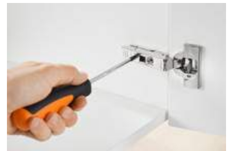
Za harmoničan izgled fuga – komforno 3-dimenzionalno podešavanje.