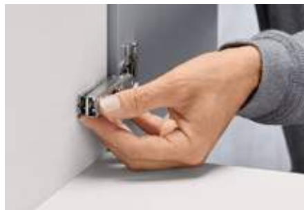
Bez použitia náradia, jednoduchá a rýchla – výhody montážnej technológie CLIP.