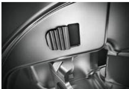
Vypínač na deaktivovanie BLUMOTION