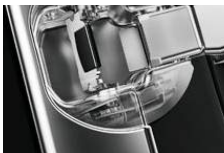
Prigušivanje na najmanjem prostoru integrirano u čašicu spojnice