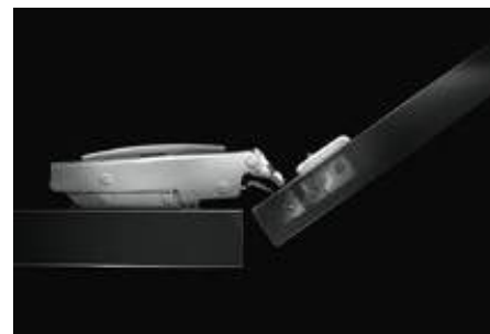
Mala dubina bušenja od 11.5 mm za debljine vrata od 15 mm i veće