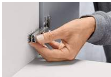
Paigaldusviis CLIP on tööriistavaba, kiire ja lihtne.