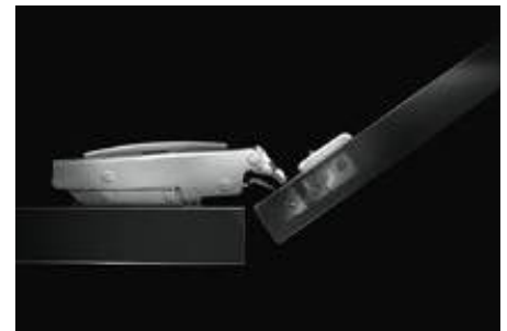
Lav boreddybde på 11.5 mm til lågetykkelse fra 15 mm