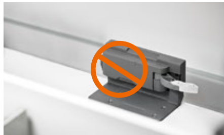
SERVO-DRIVE, die elektrische Bewegungsunterstützung