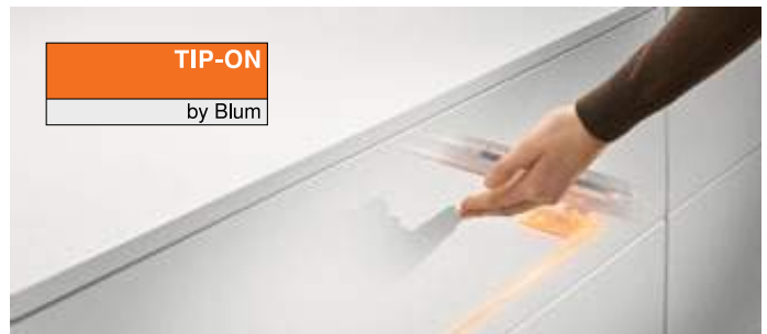
TIP-ON by Blum

TIP-ON BLUMOTION TIP-ON BLUMOTION vereint die Vorteile der mechanischen Öffnungsunterstützung TIP-ON mit der bewährten BLUMOTION-Dämpfung für sanftes und leises Schließen – rein mechanisch.