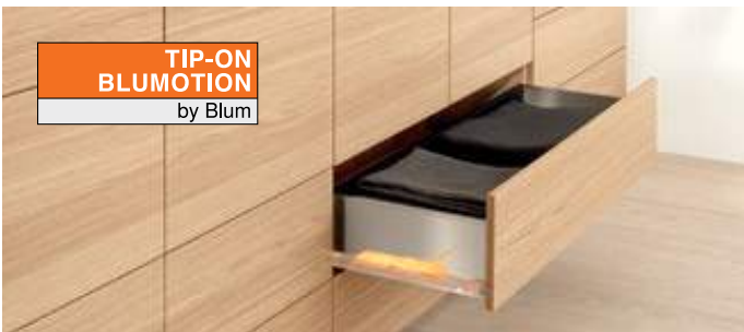
TIP-ON BLUMOTION by Blum

SERVO-DRIVE Mit der elektrischen Bewegungsunterstützung SERVO-DRIVE öffnen Möbel durch einfaches Antippen. SERVO-DRIVE ist mit BLUMOTION kombiniert.