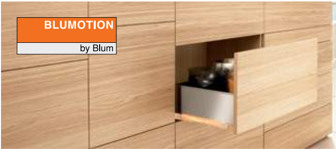
BLUMOTION by Blum

BLUMOTION Dank BLUMOTION, dem adaptiven Dämpfungssystem, schließen Möbel immer sanft und leise.