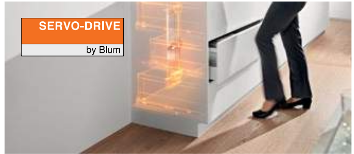
SERVO-DRIVE by Blum

BLUMOTION Dank BLUMOTION, dem adaptiven Dämpfungssystem, schließen Möbel immer sanft und leise.