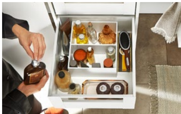
Los cosméticos en el cuarto de baño quedan ordenados como corresponde y de inmediato al alcance de la mano, aquí con LEGRABOX pure en la variante de color blanco seda mate.