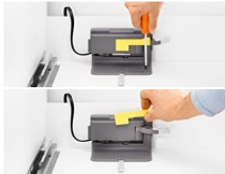
5. Aparafusar a unidade SERVO-DRIVE e retirar a proteção de transporte