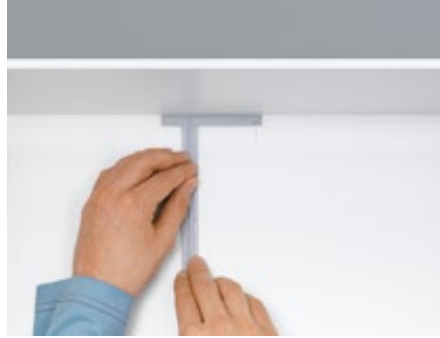
2. Posicionar a ajuda de montagem