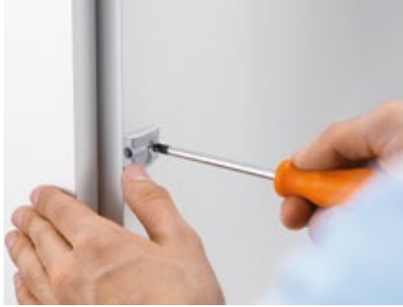
1. Montar o amortecedor espaçador Blum

O SERVO-DRIVE uno é fácil e rápido de instalar.