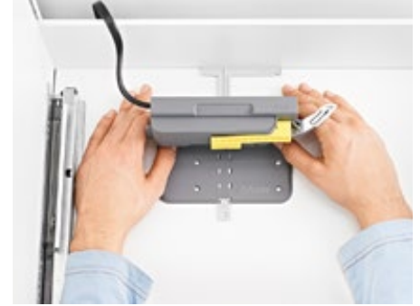
3. Deslizar a unidade SERVO-DRIVE