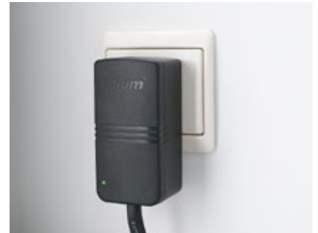
6. Conectar o SERVO-DRIVE na tomada