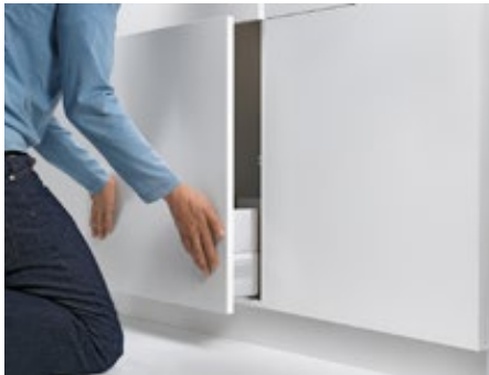
4. Enganchar a extensão e fechar – A posição de profundidade é regulada automaticamente de forma correta.