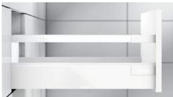
Característica: o reling quadrado

TANDEMBOX antaro está disponível em branco-seda, alumínio branco (RAL 9006) e preto-terra.