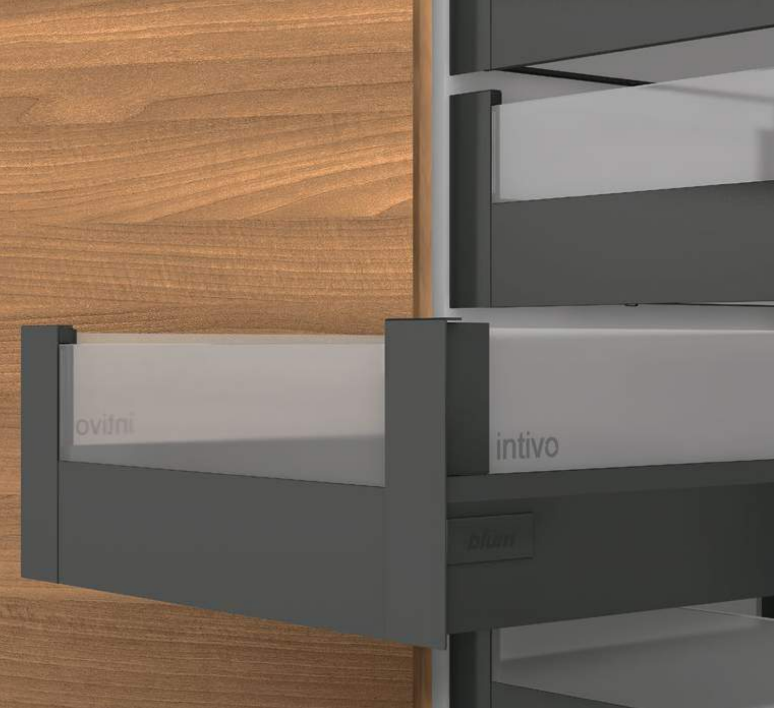
Extensão interna com elementos de design em vidro da Blum