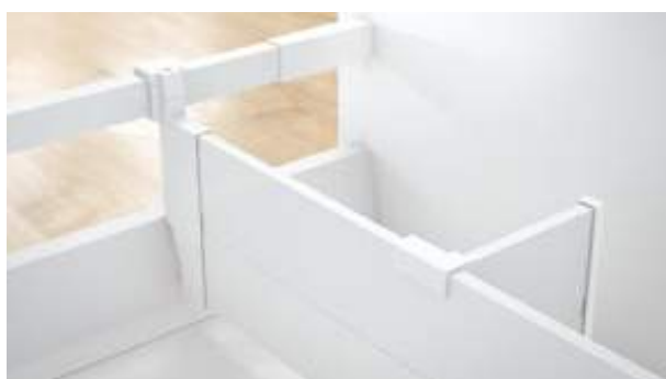
Correspondência de cores: ORGA-LINE para TANDEMBOX antaro. As partes em matéria plástica correspondem às cores da lateral.