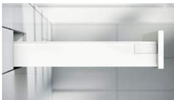
Adaptável: há uma gaveta adequada à linha para a TANDEMBOX antaro.