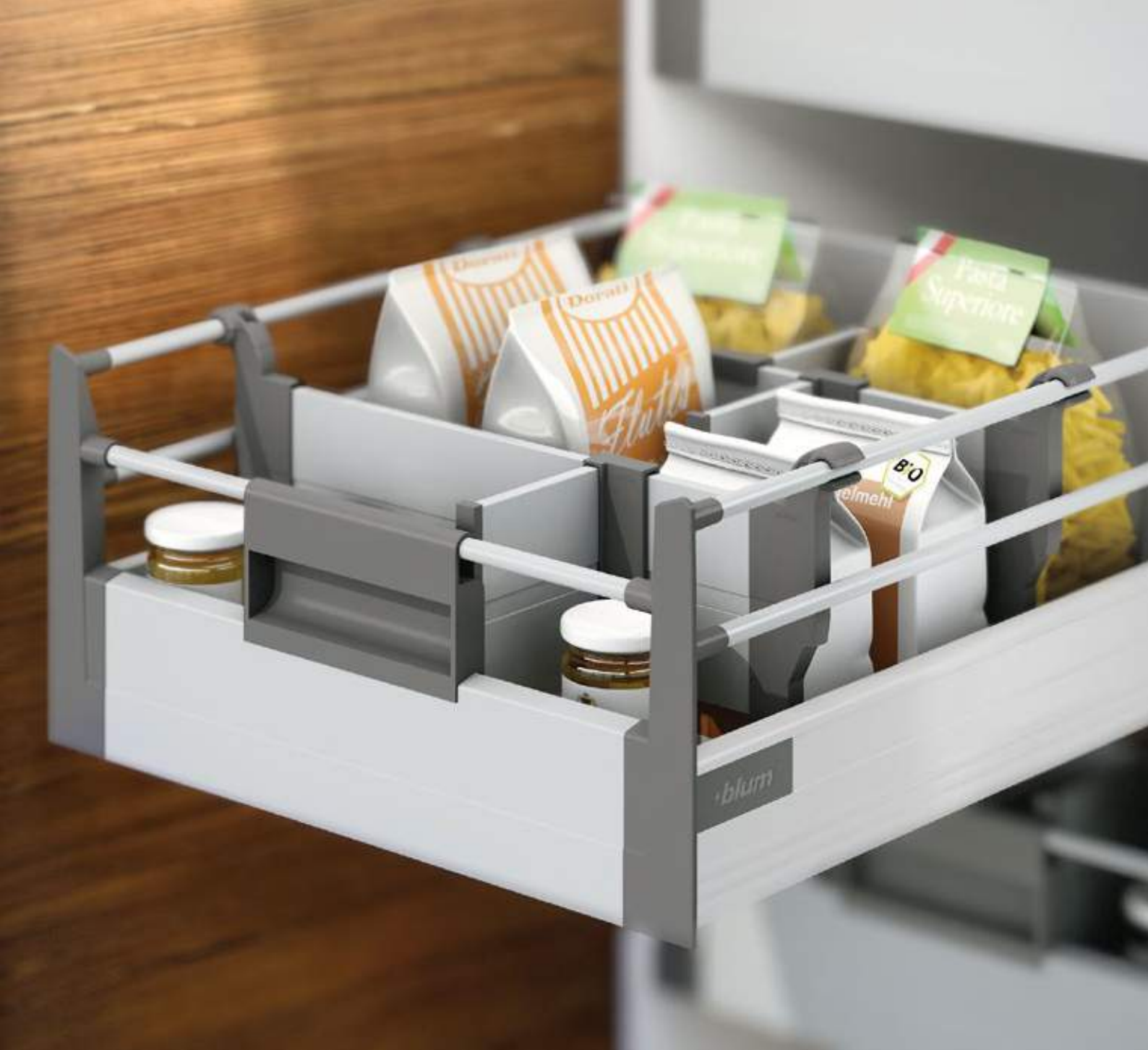
Extensão interna com reling duplo