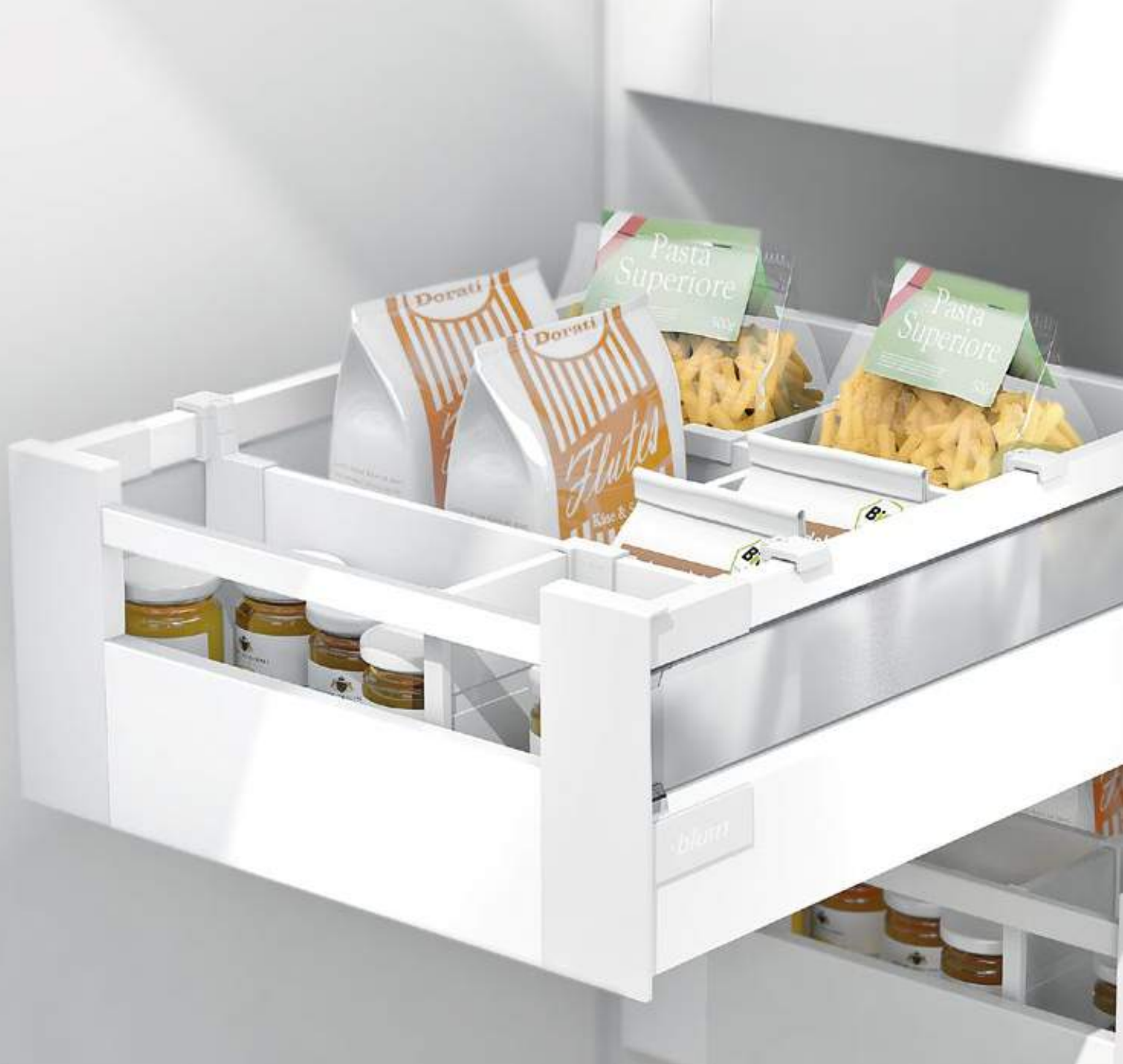
Extensão interna com reling e elemento de design em vidro acetinado da Blum