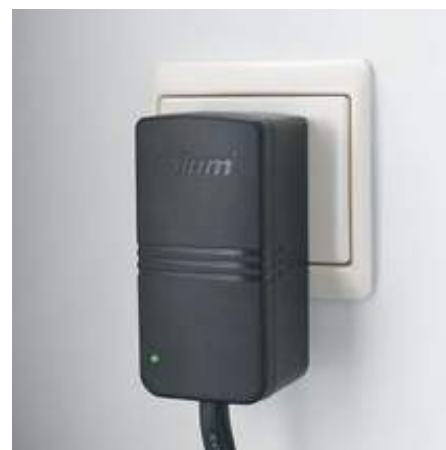
6. Conectar o SERVO-DRIVE na tomada