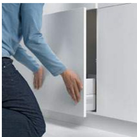
4. Enganchar a extensão e fechar – A posição de profundidade é regulada automaticamente de forma correta.