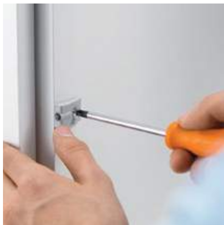
1. Montar os amortecedores distanciadores Blum

O SERVO-DRIVE uno é fácil e rápido de instalar.