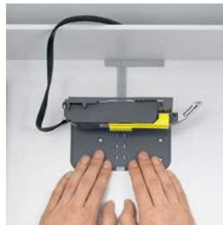
3. Deslizar a unidade SERVO-DRIVE