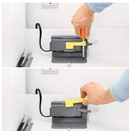
5. Aparafusar a unidade SERVO-DRIVE, retirar a proteção de transporte