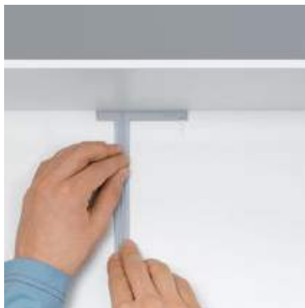
2. Posicionar a ajuda de montagem